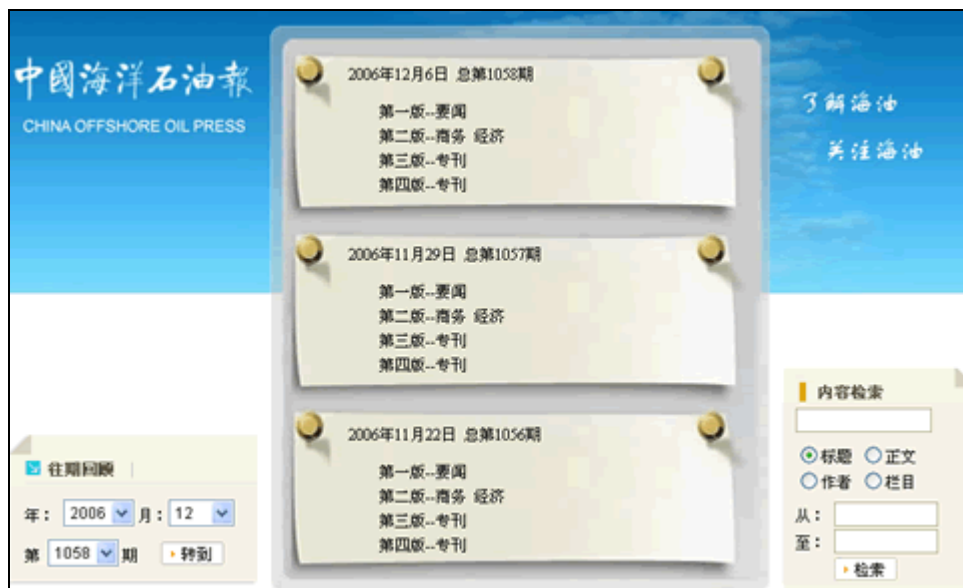
图 1 《海洋石油报》报纸首页

EDN 报纸发布系统适用于报纸网上发布，将报纸变为网络的、多媒体的形式，为读者展现读者更为生动的信息。本系统所发布的报纸，方便读者翻阅，后台数据库支持，也有利于将其作为资料进行储藏。